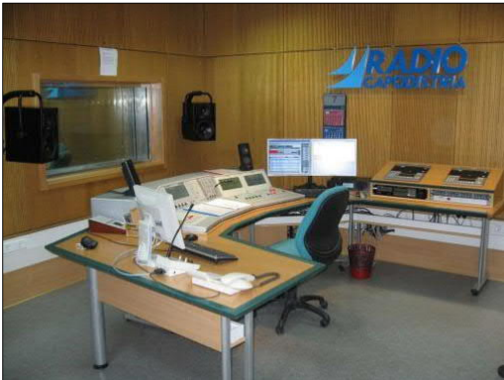
Radios du monde via SM