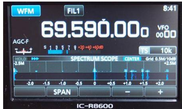
Bild 1 visar jämförelse mellan Icom 8600 och 8500. Bild 2 visar 8600 pekskärm (touch screen).

More than four months I have been dx-listening with my new communications receiver Icom IC-R8600. This receiver was introduced in summer 2017. The previous version Icom IC-R8500 was discontinued some years ago. So far I can say that 8600 is the best receiver I have ever owned. If and when the software for Icom 8600 is developed and bugs omitted, this is my receiver for the next 20 years.