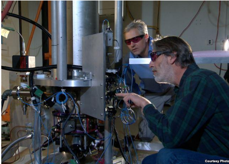
NIST physicists Steve Jefferts (front) and Tom Heavner with the NIST-F2 “cesium fountain” atomic clock, a new civilian time standard for the United States.

The Trump administration has asked Congress to cut about $26.6 million and 136 jobs from NIST’s budget. That amount includes the cost of operating the timekeeping stations.