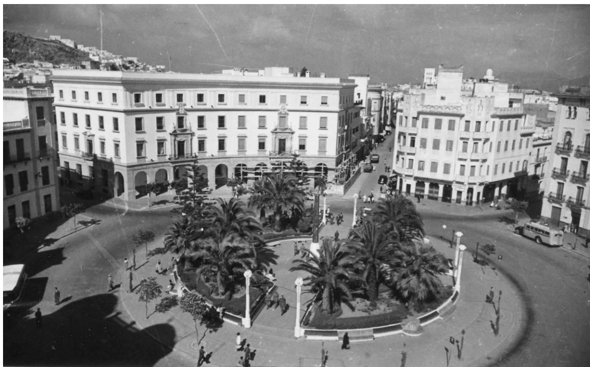
Studios och management Radio Dersa

Den som kommer till syds Spanien skall absolut försöka åka över till Spanska Marocko och tillbringa några dagar där. För oss svenskar låter spanska Marocko som ett litet, obestämt område uppe i nordvästra hörnet av Afrika, och folk i allmänhet, som inte har varit där, känner knappast till att det finns ett land med det namnet. DX-arna gör det, åtminstone de som hört och fått QSL från Radio Dersa.