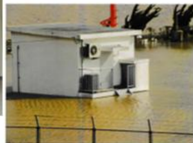
2004年10月21日台風23号による円山川堤防決壊の水害でほぼ40時間放送が中断しました。局舎には浸水しましたが奇跡的に送信機は被害を免れました

Sänder ett QSL-kort + bildcollage från JOCE (CRK) Toyooka 1395 kHz som är ett 1 kW-relä av huvudstationen på 558 kHz. De ser ut att ha råkat ut för en översvämning 2004 om jag förstår rätt? (tnx JOB)