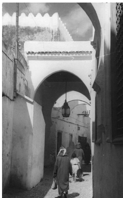
Etersvep nr 11-1955. T.v. QSL från Radio Dersa och ovan ingången till Casbah, Tetuán.