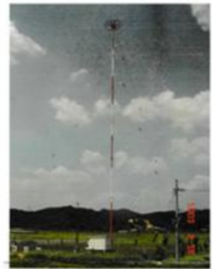
柱管円m20 ママにて設置