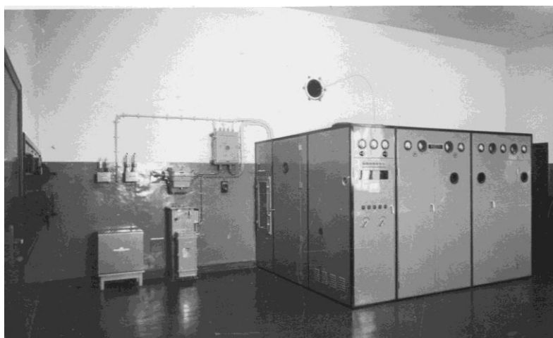
Studio och tx Radio Dersa