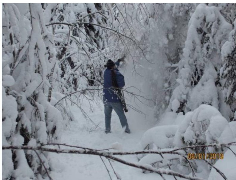
DAD i snölandskapet

Även om det var lätt att hitta felen, så var det inte lika lätt att laga. Ute i skogsterrängen var det svårframkomligt. Ca en halvmeter djup snö att trussa i. Vi började med 317°. Eftersom det verkade fattas ca 10m, behövde vi skarva i en bit. Det skulle alltså bli två skarvningar. När vi hade gjort den första skarvningen var vi stelfrusna i såväl tår som fingrar.