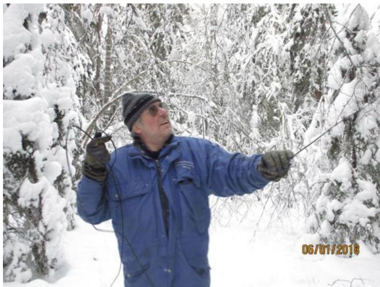
Det gäller att få fatt på tråden....

317° var av ca 50 m bortom starten. På 255° hade trådarna ryckts loss från kabelskorna på burken närmast torpet.