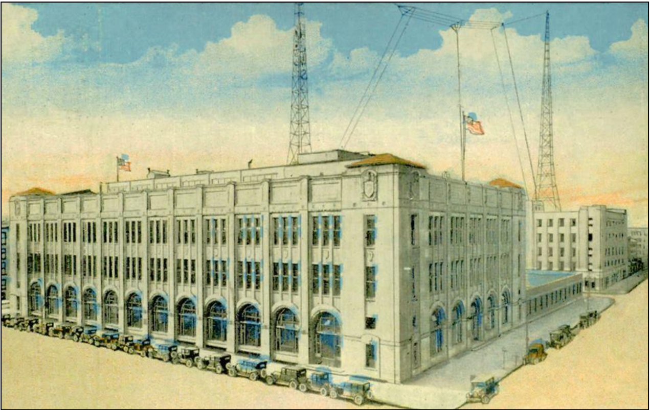
WWJ Detroit MI - 950 kHz