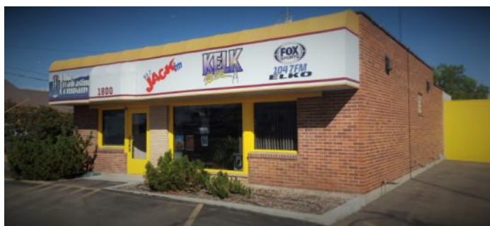
KELK Elko NV 1240 kHz, tnx HS

Since Overcomer Ministry leader, “Brother Stair” was arrested on multiple charges including sexual assault, I think many of us assumed his on-air programming would soon come to an end. A number of private broadcasters had already pulled his programming after his arrest on Monday (Dec 18). Now that Overcomer has announced the halt of all radio broadcasting – and the voice of Overcomer, Brother Stair, is in jail – their satellite and online feeds will likely replay old content. (From swling.com, reposted on Facebook by Mike Brooker via NRC DX News 85/08)