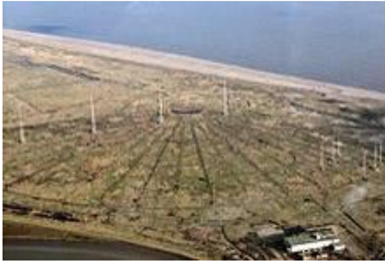
The antenna park at Orfordness

Modern houses often contain foil-lined insulation in the cavity walls. In these circumstances you will likely find reception better by placing the radio close to a window. Modern houses also contain a lot of computer and switching-power supplies which can generate a lot of interference. Try moving a portable radio around, or rotating its direction to improve reception.