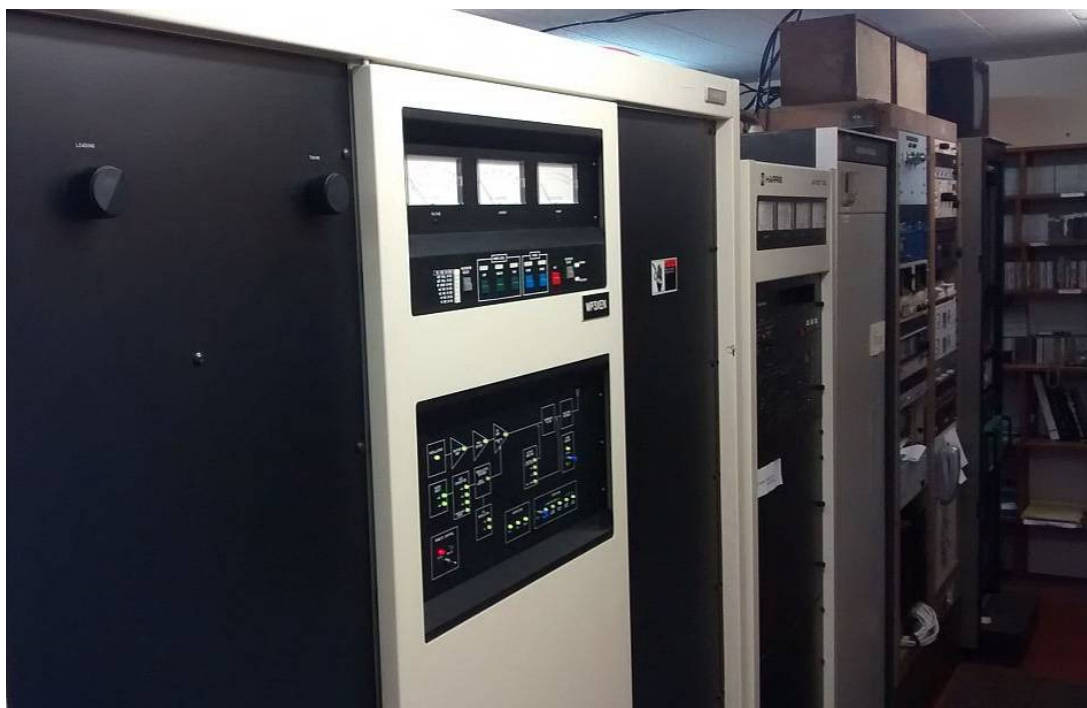
Sändare och kontrollrum. QSL finns i MVE 57/16. Tnx JOB