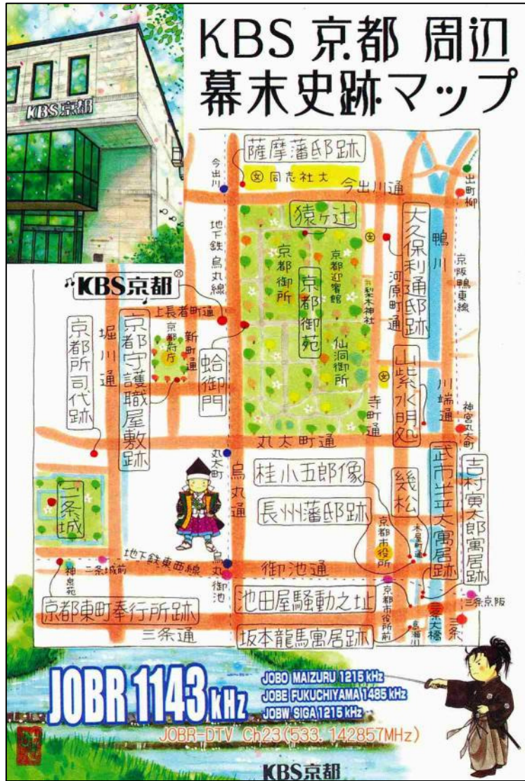
QSL-kort och dekal från JOBR-1143 kHz. Tnx RÅM