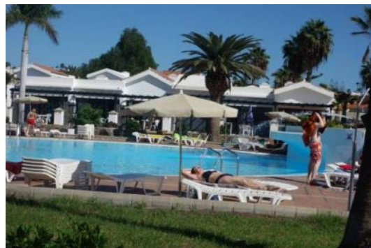
Två bilder från hotellvistelsen i Maspalomas