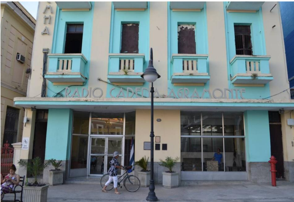
Stationsbyggnaden för Radio Cadena Agramonte, Camagüey