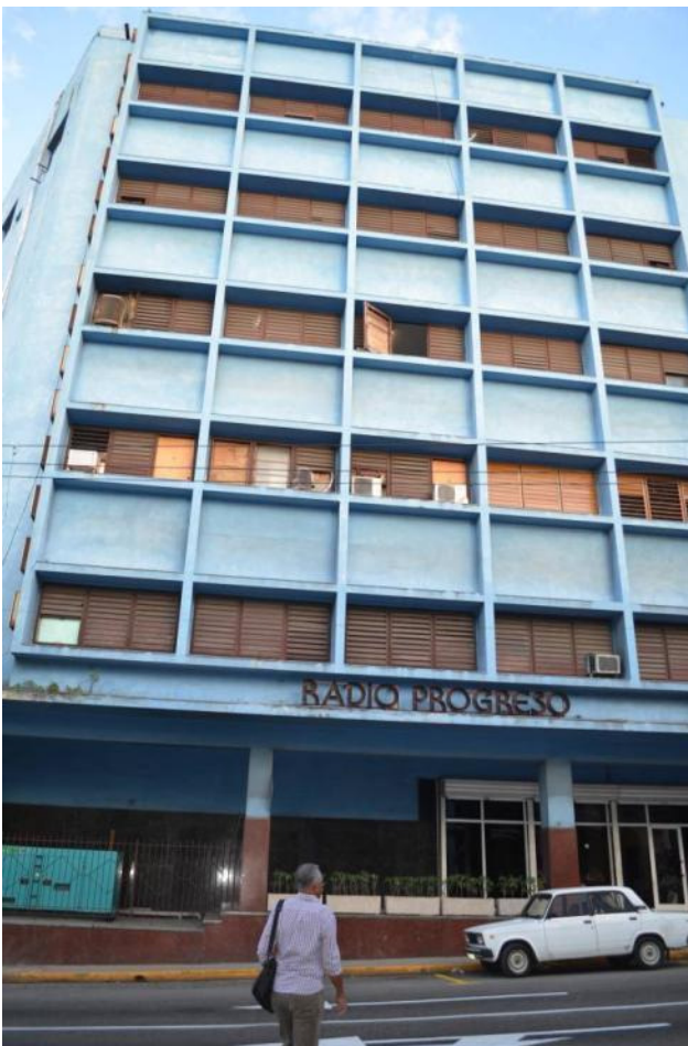
Radio Progreso, La Habana