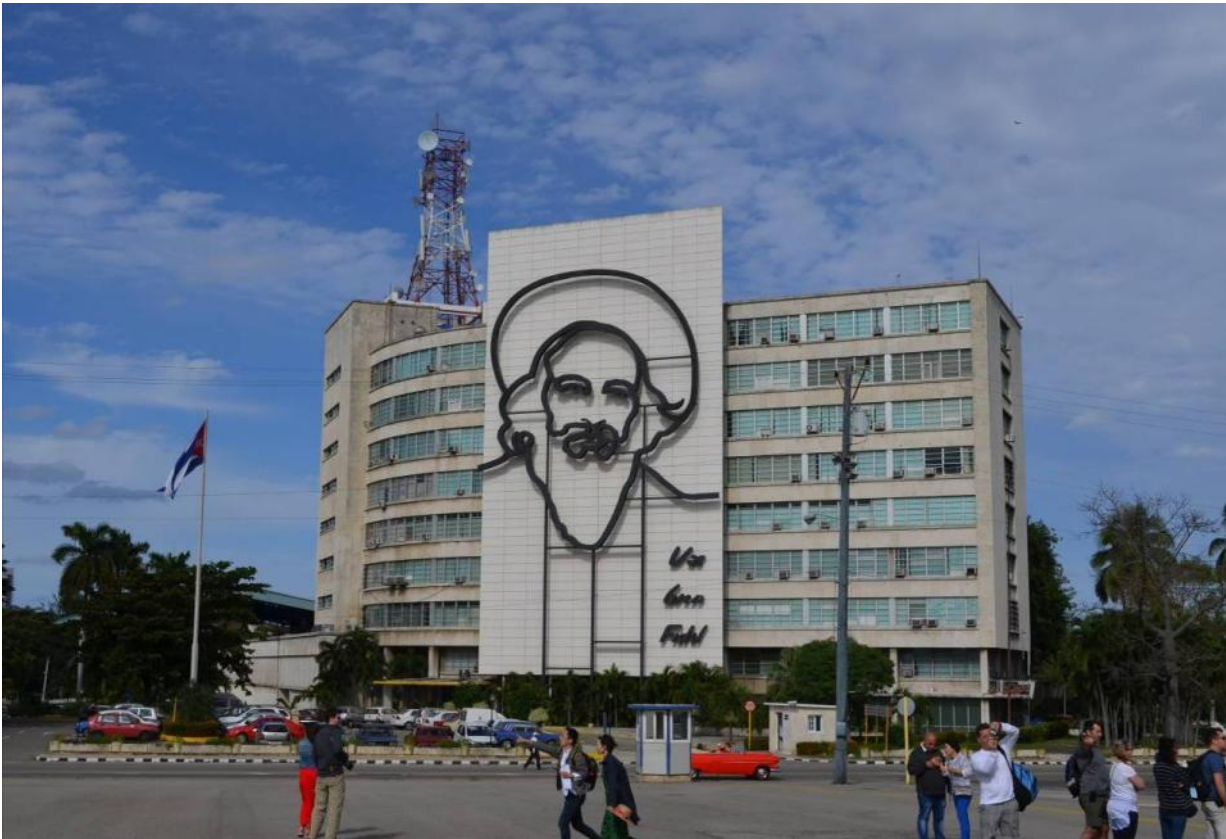
Radio- & TV-huset, La Habana