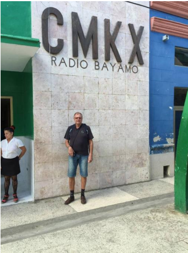
Artkelförfattaren framför entrén till Radio Bayamo