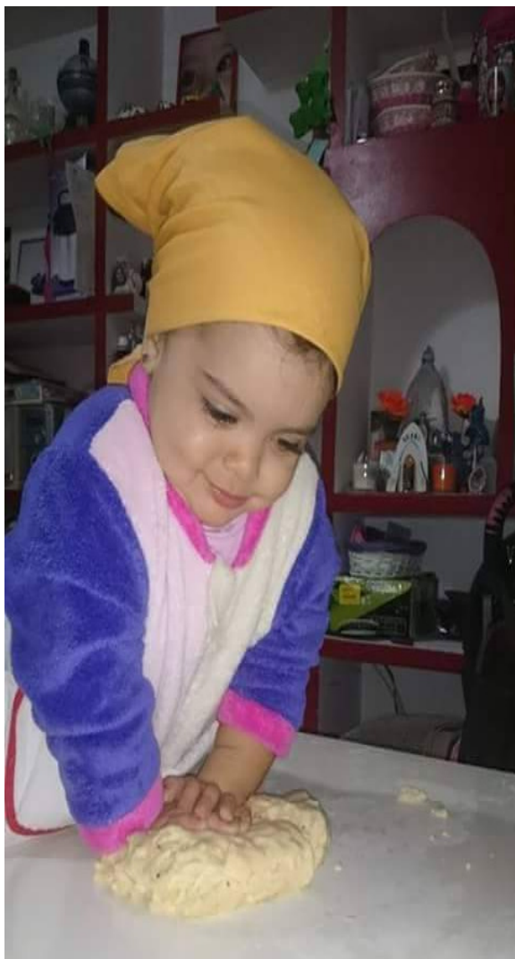
En mennonitisk flicka i Chaco hjälper till med påskbaket

Konstigt kan man också tycka det är att när vi i Sverige flyttar fram klockan 1 timme kl 0200 på natten den 27 mars, så gör man precis tvärtom i Paraguay: vid lokal midnatt sätts klockan tillbaka till 2300. Men medan vi går mot sommar, går man i Paraguay mot vinter.