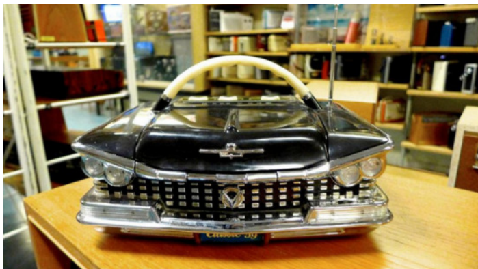
När transistorradion kom i slutet av 50-talet dök de upp i de mest fantastiska skepnader. Här i en frontmodell som är en kombination av en Chevrolet och en Buick från 1959.