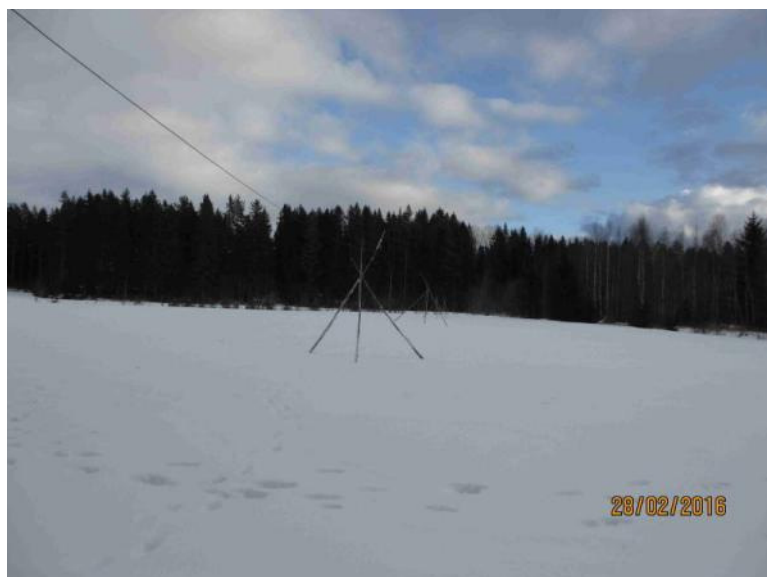
300 grader över fältet