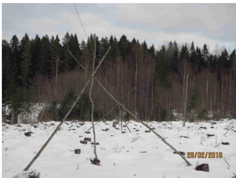
Stödpunkter på hygget