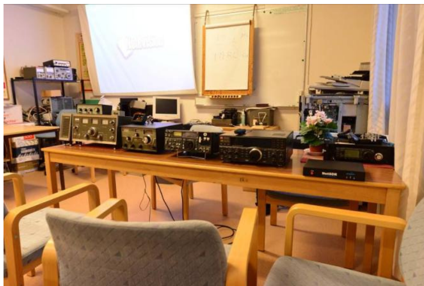
Denna bild föreställer de medhavda mottagarna Trio 9R59DS med Heathkit Q-multiplier GD-12, Drake SPR-4, Icom R-70, Japan radio NRD-545 och RF-Space Net-sdr.

Intresset för den här formen av hur radiohobbyn kan bedrivas var stort hos radioamatörerna i Sundsvall och mer än 20 av klubbens medlemmar fanns på plats. Frågorna var många liksom en del diskussioner om hur hobbyn utvecklats.