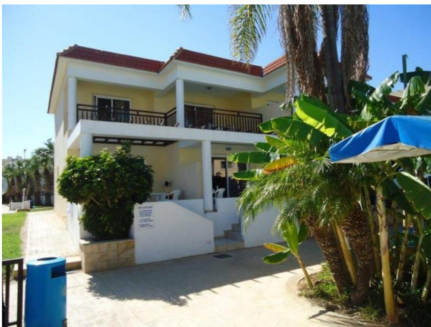
Dubbelbalkong med Medelhavet nedanför

Efter fyra timmars flygning från Arlanda landar man på Larnacas nya flygplats. Efter en timmas bussresa kommer man till Protaras, som är en by som ligger precis bortanför den enorma sändaranläggningen på Cape Greco. 24 grader i luft och vatten. Lite turister bortsett från ryssar. Hotellet erbjöd en stor lägenhet med stor dubbelbalkong mot öster precis ovanför Medelhavet. Utmärkt läge för MVDX. På balkongen monterades Sony ICF 1000 T med TN:s vridbara loop. Inga lokala störningar, men starka iranier på nästan varje frekvens. Det var en besvikelse. (Times UTC).