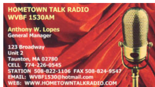
Home Talk Radio

ARC/SWB-konventet på Flustret i Lessebo i maj 2014 var ett möte med de verkliga teknik-, antenn- och listnördarna, av vilka de flesta lever i nuet och inte bara talar om hur det en gång var. Det är ett gäng entusiaster, som förvandlat DX-ingen till någonting helt annat, möjligen tagit upp den till nya, högre, nivåer, och där QSL-en betyder mindre än det faktum att man lyckats skönja en knappast läsbar signal från en hittills okänd station på sin dator.