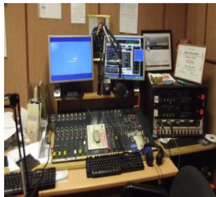
Left setting up our antenna, right our mixing and broadcast unit in the studio 1.

I (Keith) used to look forward to QSL cards when I worked sideband radio with my Cobra 128 Gxl so please accept a copy of our poster as confirmation of your copy on 1521 medium wave.