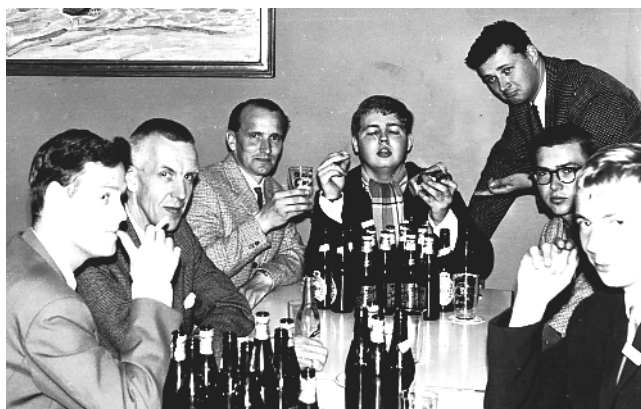
Man kan samla på allt, som här ölsamling på Tuborg. Många kända DX-profiler var med

I beslutet ingår att vi gör oss av med den gamla villan, som tjänat oss så väl sedan i november 1972. Den nya kommer att ha betydligt färre och mindre utrymmen för att samla all den nostalgi, som inryms i nästan ett helt DX-liv – i alla fall sedan den 2 december 1957. Det är med andra ord dags för mig att göra mig av med det mesta av alla ”döda” ting som jag samlat på mig under årens lopp. Kanske finns det någon i lä-