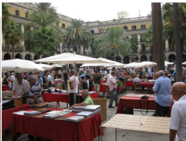
Collector's market i Barcelona