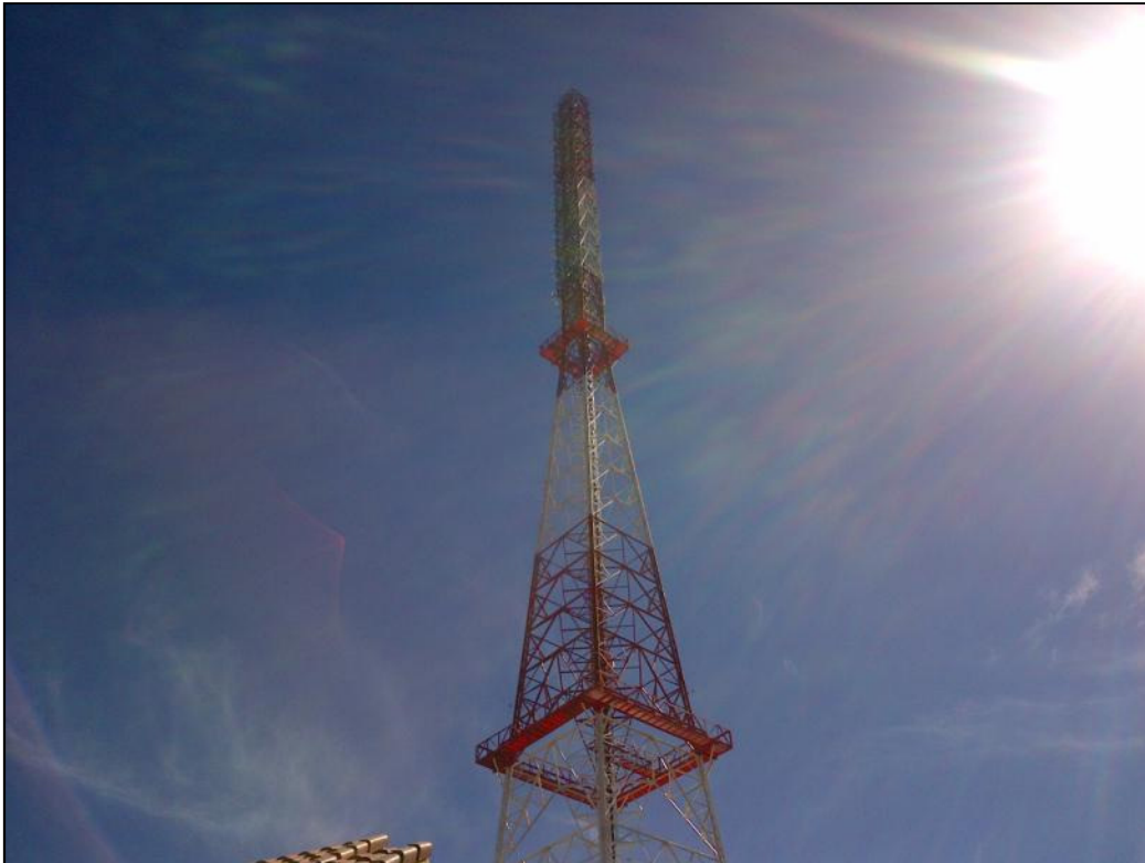
Ovanstående sändarmast tillhör XERED Mexiko DF-1110 kHz och kortet nedan kommer från KAAY Little Rock AR-1090 kHz. Grattis säger vi till JOB resp RÅM!