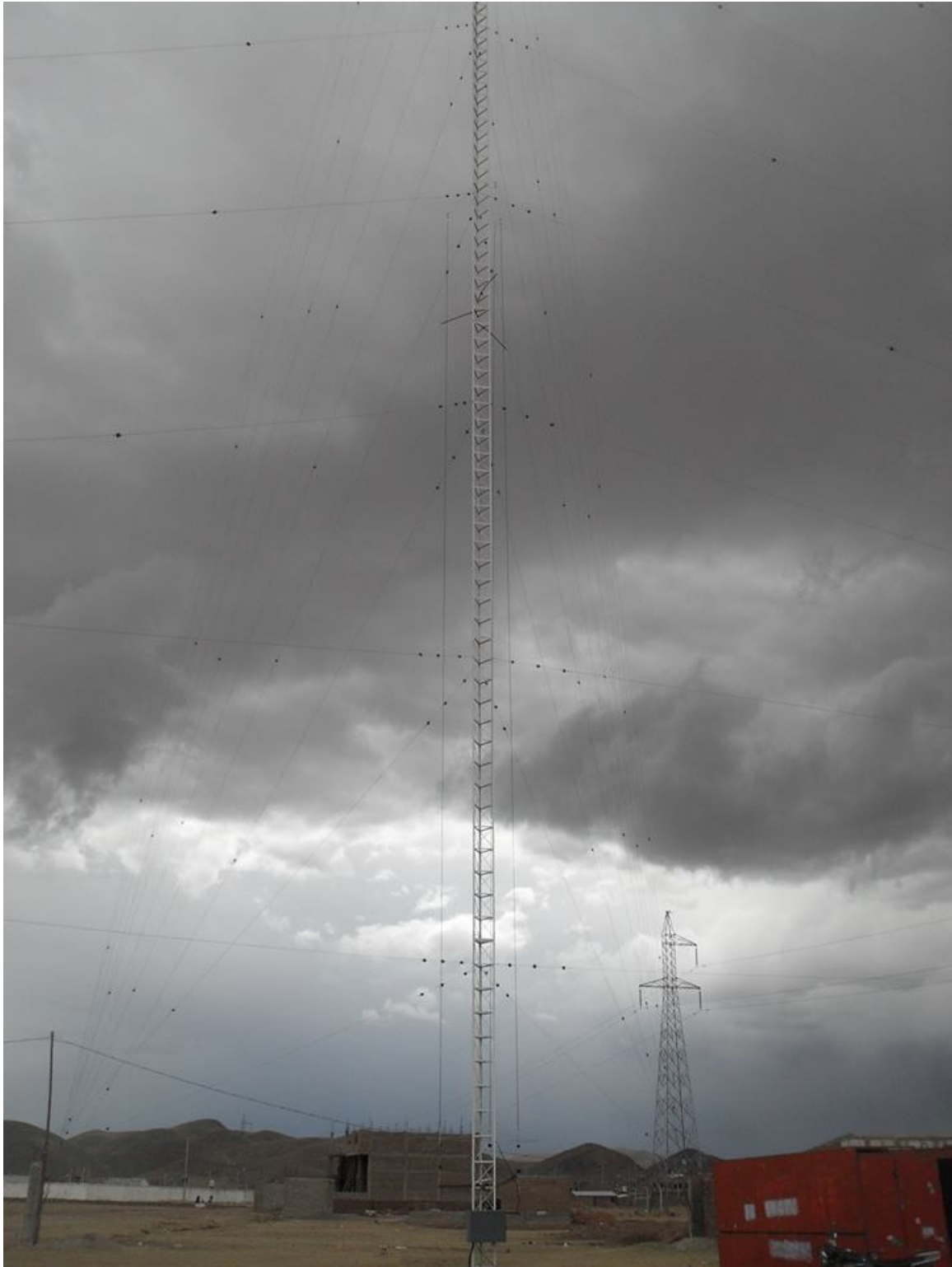
OAU7Z Radio Carráviz transmitter site