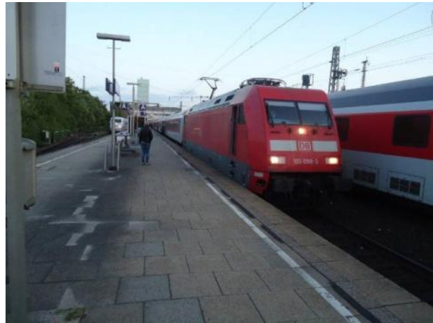
Tåget framifrån med sovvagnar först

På hemvägen hälsade vi på bekanta, så den togs i korta etapper om c:a 30 mil. Med autobahn tar det inte lång tid. Efter vägen finns det ju prisvärda och utmärkta pensionat eller B&B, som finns listade i boken "Links und Rechts der Autobahn".