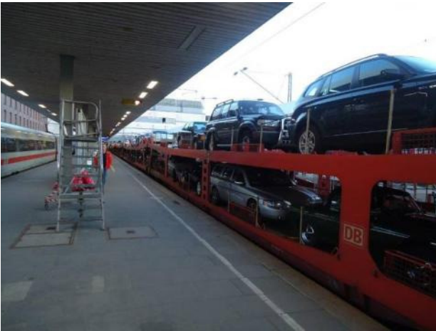
Vagnar med bilar