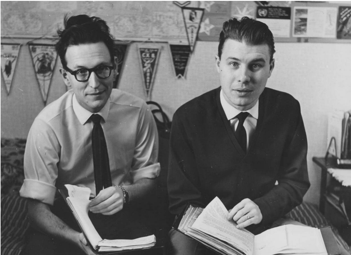
JER och LR hos HK (ex-HN) 1964

Det skulle dröja tio år till innan vi sågs en vivo . Sedan dess har vi bara träffats sporadiskt, bl a i samåkning till något DXP i Bergslagen. Häromåret fick jag en bortglömd 3-tumsrulle i retur från honom. Den innehöll asiater en masse som jag spelat in i början på 60-talet.