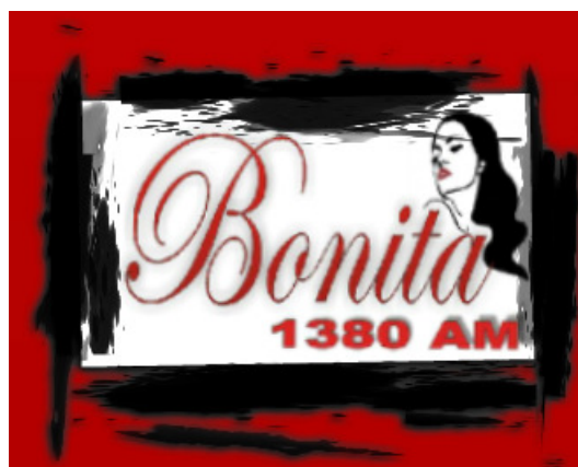
WHEW Franklin TN-1380 kHz, tnx HS

http://www.nytimes.com/2013/11/02/business/media/fcc-plans-sweeping-changes-to-bolster-am-radio.html? r=0