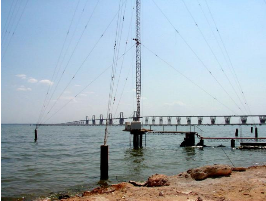
Tore B Vik: Gunstig antenneplassering for Radio Reloj, Maracaibo – 1300 kHz