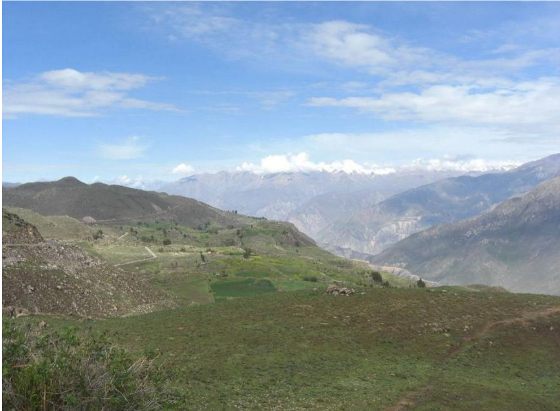
Ovan naturbild från en morgon när vi spanade efter kondorer. Nedan bild tagen på 4000 m höjd där lama, kamoloiddjur och får betar.