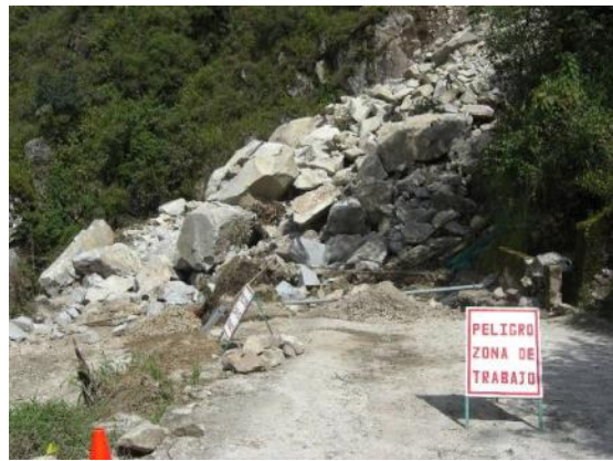
Naturbild från färden till vassflottarna på Titicacasjön och till höger ras på vägen till Machu Picchu

Det naturliga besöket där är förstås att besöka folket som bor på vassflottar i sjön. Sedan gick färden vidare till Cusco där vi var i fem dygn med utflykter varje dag. Ena utflykten var naturligtvis till Machu Picchu med tåg från Ollantaytambo och det var verkligen imponerande!