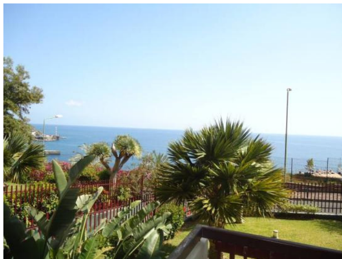
Blå Atlanten direkt från balkongen. Riktning sydost/ost.

En av de intressanta stationerna hördes den 14.3 vid 22 var SER Radio Ceuta på 1584 kHz med ett diskussionsprogram om flyktingsströmmen/invandringen till Ceuta och Melilla. Den hördes bitvis riktigt bra, men fadade. QRM från de andra SER-stationerna på fq. Egna ID vid flera tillfällen. Från Algeriet hördes flera stationer, bl.a. Adrar 1089 kHz med spansk nyhetssändning 22:30. ID "Radio Algérie Internacional". På 990 kHz hördes en kväll en häftig politisk diskussion på ett afrikanskt lokalspråk. Kl. 23 hade de nyheter. Fadade väldigt upp och ned, men grovt gissat var det antingen TZA eller NIG. Något ID i samband med nyheterna kunde ej höras. De bara gick direkt över.