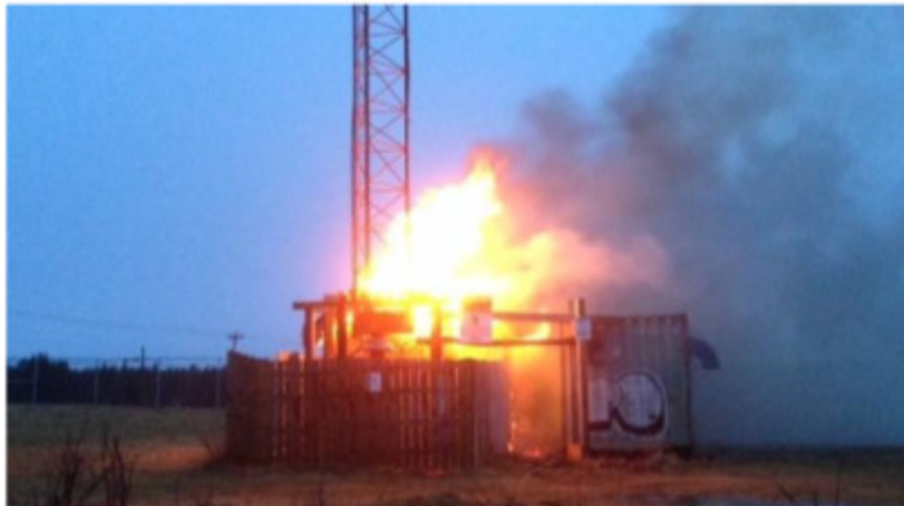
Fire destroyed the CJYQ transmitter building on January 28, 2014

CKDM-730, CJVA-810, CKLQ-880, CJDC-890, CFMB-1280 have definitely been staying on day pattern at night lately. (Reports to DXLD)