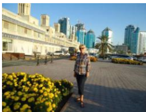
Två bilder från resan. Till vänster utsikt från balkongen på hotellet, till höger Central Souk (marknaden till vänster), i övrigt moderna byggnader.

Eftersom vi kom till hotellet kring midnatt var det bara ut på balkongen och kolla. Allt var frid och fröjd, men Iran täckte nästan varje frekvens och de var hemskt starka. På kvällen såg vi från balkongen de kraftiga ljusen från de stora anläggningar som ligger efter Hormuz-sundet på de iranska öarna. Längre är det inte. På dagen kunde man se de jättetankers som var på väg till eller ifrån Abadan. Temperaturen var 22 i luften, 21 i vattnet och 26 i poolen. Solen sken alla dagar utom en förmiddag, då vi gjorde en tur in till Central Souk. Vilken jättemarknad för guld, silver, mattor och kläder. Intressant för det är en gammal byggnad, som är modernt uppfräschad, men behållit de gamla fasaderna. På sommaren kan temperaturen gå upp till 55 C och då måste man vistas inomhus i tempererad miljö. Värst är månaden augusti.