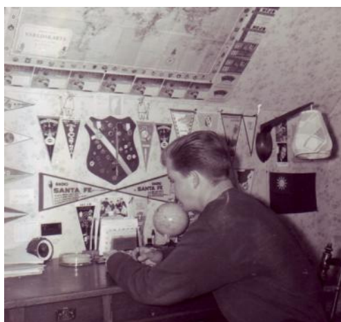
BF i K-n skriver brev till BF i K-n