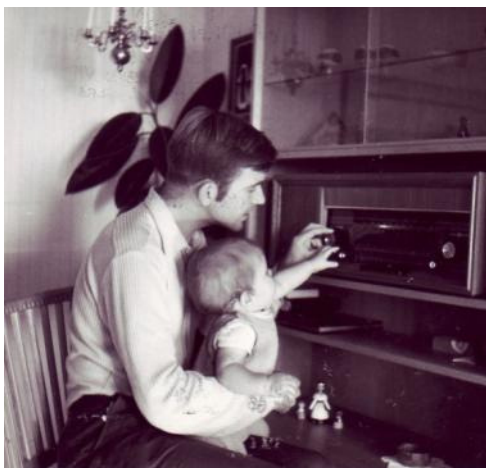
Född till DX-are – knappast!

PS! Jag kom på varför jag inte var så aktiv som DX-are 1968-1981. Gifte mig, byggde hus, fick barn... Men ibland fick barnen allt hänga med, vilket framgår av fotona. DS.