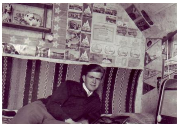
Typisk DX-lya i Klintehamn