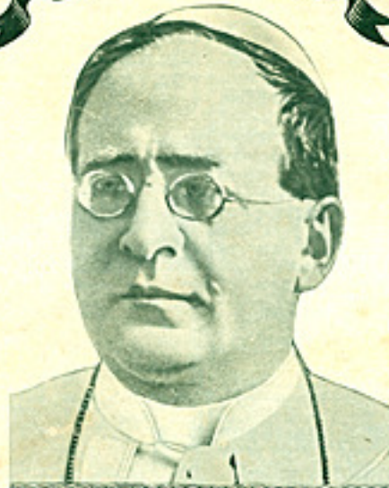
Hans Helighet Påven Pius XI har i skrivelse från Rom, daterad 12/9 1925 låtit beställa en Centrum radiomottagare av senaste modell.