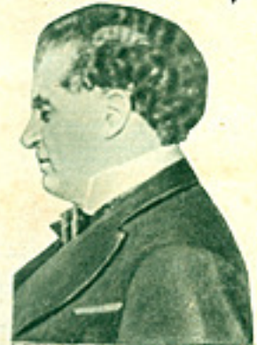
Pietro Mascagni, den världsberömda kompositören — "Cavalleria rusticana" mästare — har i brev av den 19/10 1925 beställt för sig, lev. en Centrum Radio.