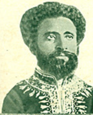
Halle Selasde, Kejsaren av Absessien, har i telegram, daterat 22/10 1925, låtit beställa en Centrum av årets modell.