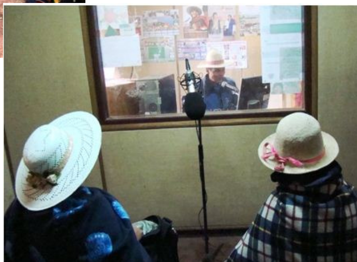
Sändning pågår i Radio Andina